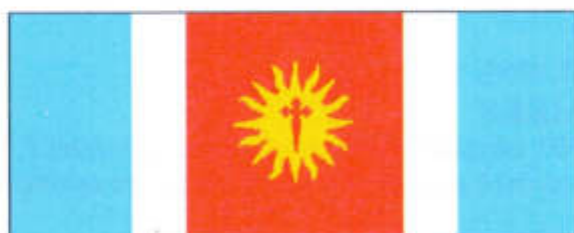
Santiago del Estero