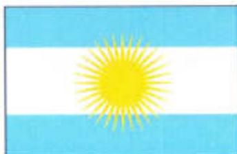
San Juan (rub)