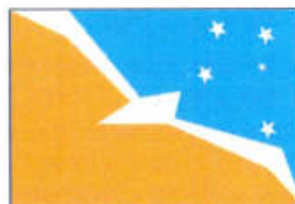
Tierra del Fuego, Antártida e Islas del Atlántico Sur